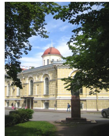
Институт химии силикатов им. И.В. Гребенщикова РАН