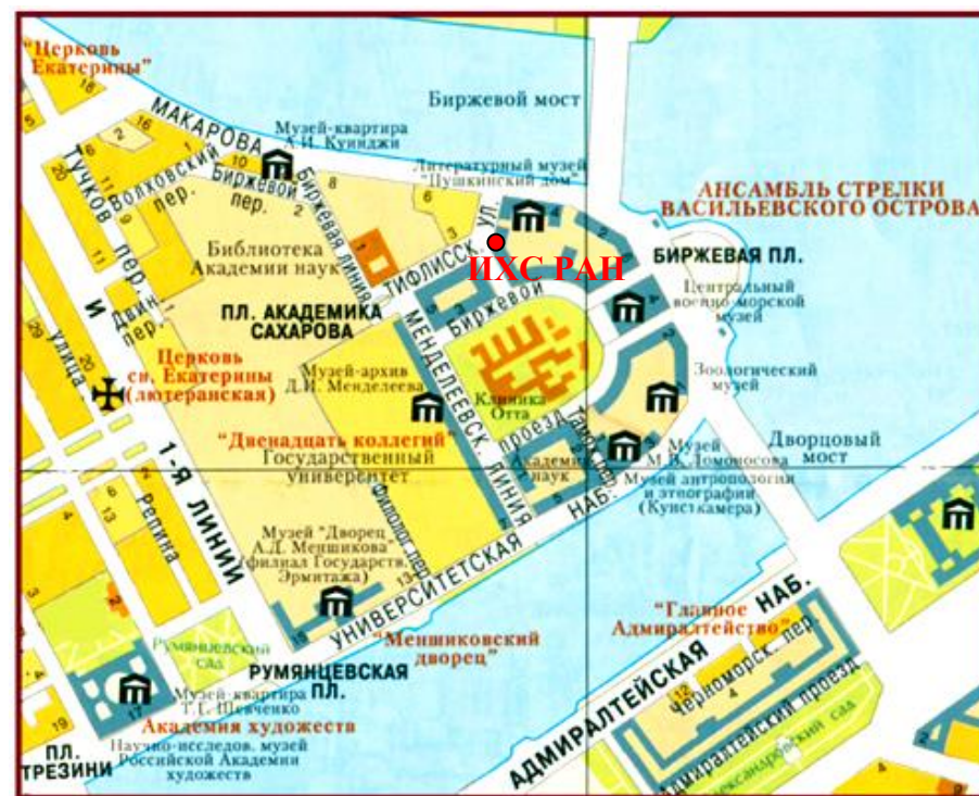
Месторасположение ИХС РАН на стрелке ВО

От станции метро: «Невский проспект» – транспорт автобусы № 7, № 24, троллейбусы № 1, 10 до остановки «Университетская набережная» (Зоологический музей) или автобус № 191 и троллейбус № 7 до остановки «Биржевая площадь» (стрелка Васильевского острова, Ростральные колонны).